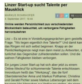
Linzner StartUp sucht Talente per Mausclick, der Standard, 4. September 2017, online