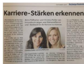
Karriere-Stärken erkennen!, Salzburger Nachrichten, 14. Oktober 2017, Seite 12