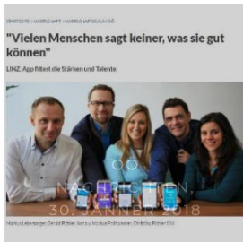
Vielen Menschen sagt keiner was sie gut können, OÖ Nachrichten, 30. Jänner 2018, online

https://www.innoviduum.at/innoviduum/presse-media-center/