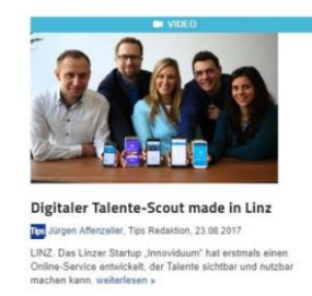
Digitaler Talente Scout made in Linz, Tips, 23. August 2017, online