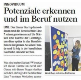
Potentiale erkennen und im Beruf nutzen, Tips Linz, KW-46 2017, Seite 23