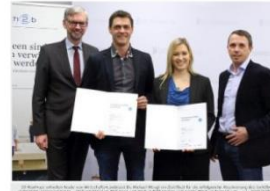
23 Start-Ups haben es mit Hilfe von tech2b auf den Markt geschafft, Wirtschafts|Zeit, 2. Februar 2017, online