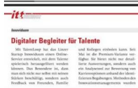
Digitaler Begleiter für Talente, it&business, Mai/Juni 2017, Seite 26

Workshop: Um authentisch zu sein, braucht es mehr als die üblichen Schlagworte und Standardfloskeln.