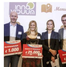
"We Start Up": Heute kürte die Gewinner 2017, Heute, 6. Oktober 2017, Seite 18-19