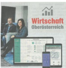
digitaler Talente Scout, Krone OÖ, 22. August 2017, Seite 28