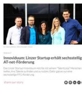
Linzer Startup erhält AT-net Förderung, der Brutkasten, 18. August 2017, online