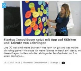
Startup Innoviduum setzt mit App auf Stärken und Talente von Lehrlingen, Wirtschafts|Zeit, 13. November 2017, online