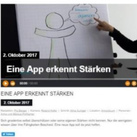
Eine App erkennt Stärken, LT1, 2. Oktober 2017, Video