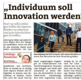
Individuum soll Innovation werden, Linzner Bezirksrundschau 6.10.2017, Lehrlingsausgabe, Nr 40/05, Seite 68