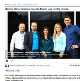
Start-up Unternehmen - Talente finden und richtig nutzen, Tips Wels, 14. August, online