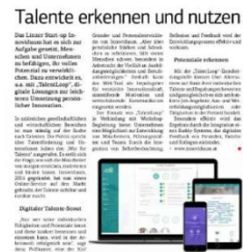
Talente erkennen und nutzen, OÖ Wirtschaft, WKOÖ; 29. Sept. 2017, Nr 39, Seite 28