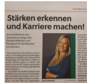
Stärken erkennen und Karriere machen!, Kurier, 29. Oktober 2017, Seite 16