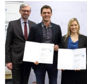
Oberösterreichs bunte Gründerszene: Vom Lift-Notruf bis zur Talente-App, OÖ Nachrichten, 8. Februar 2017, Seite 7