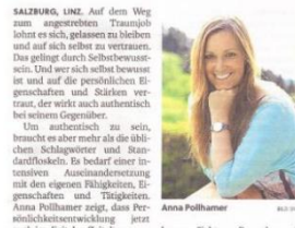
Selbstbewusst und authentisch im passenden Beruf, OÖ Nachrichten, 14. März 2017, Seite 32

Workshop: Um authentisch zu sein, braucht es mehr als die üblichen Schlagworte und Standardfloskeln.