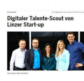
Digitaler Talente Scout von Linzer Start-up, Heute, 9. August 2017, online