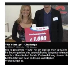
"We start up" - Challenge", W24, 5. Oktober 2017, Video